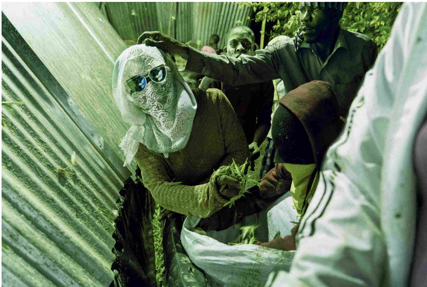
Michele Sibiloni, Untitled, Bundibugyo, Uganda 2017 © Michele Sibiloni