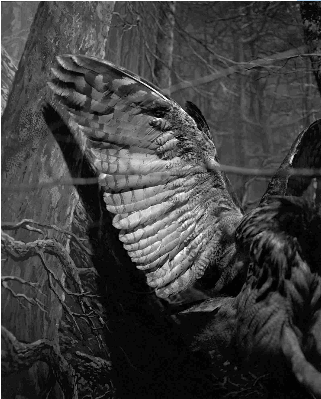
Benedetta Casagrande, All Things Laid Dormant , GFI#11