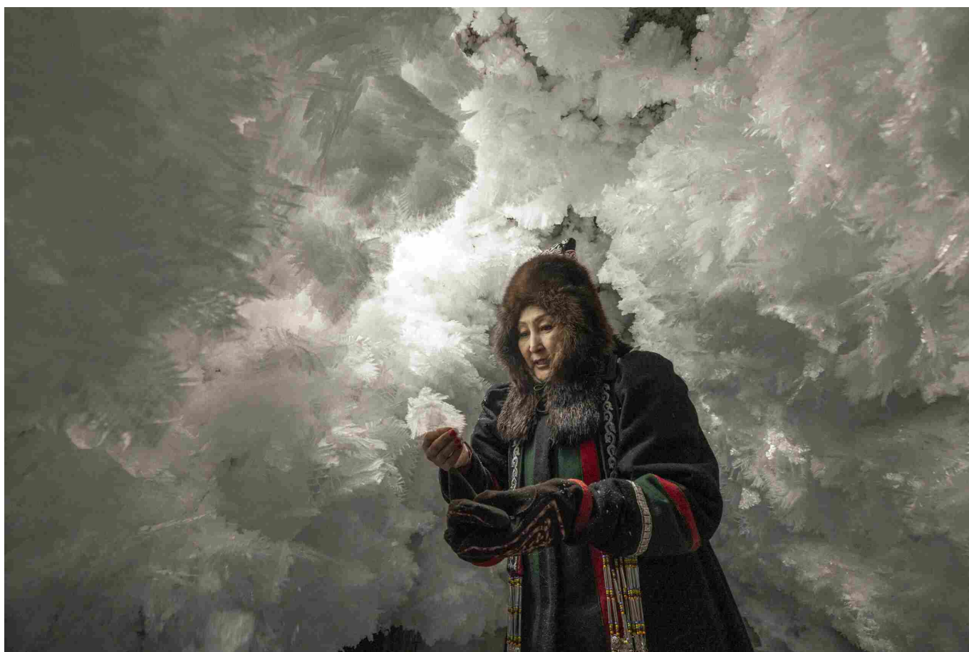
Permafrost #3

Nel grande corridoio centrale, Natalya Saprunova espone il progetto Permafrost che racconta la vita delle popolazioni dell'estremo nord del continente asiatico. Qui, nei suoi lunghi viaggi in compagnia della macchina fotografica e di un taccuino, la fotografa russo-francese scopre luoghi come la Yakutia e le sue popolazioni indigene, tra cui i pastori di renne Evenki e gli Yakuti, allevatori stanziali di mucche e cavalli. I colori tenui dei suoi scatti restituiscono l'ansia di queste comunità, testimoni del rapporto simbiotico con una natura estrema che oggi è messo a rischio dalle conseguenze dell'industrializzazione.