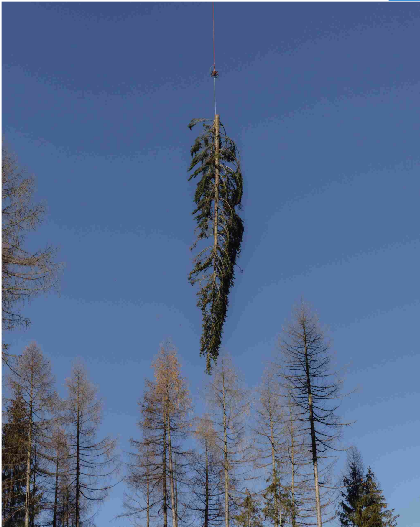
Un elicottero rimuove un albero caduto da un sentiero vicino a Digionera / A helicopter removes a fallen tree from a path near Digionera. Digionera (Belluno), 2020 – There's no calm after the storm (2019-2023)

Ritaglio stampa ad uso esclusivo del destinatario, non riproducibile.