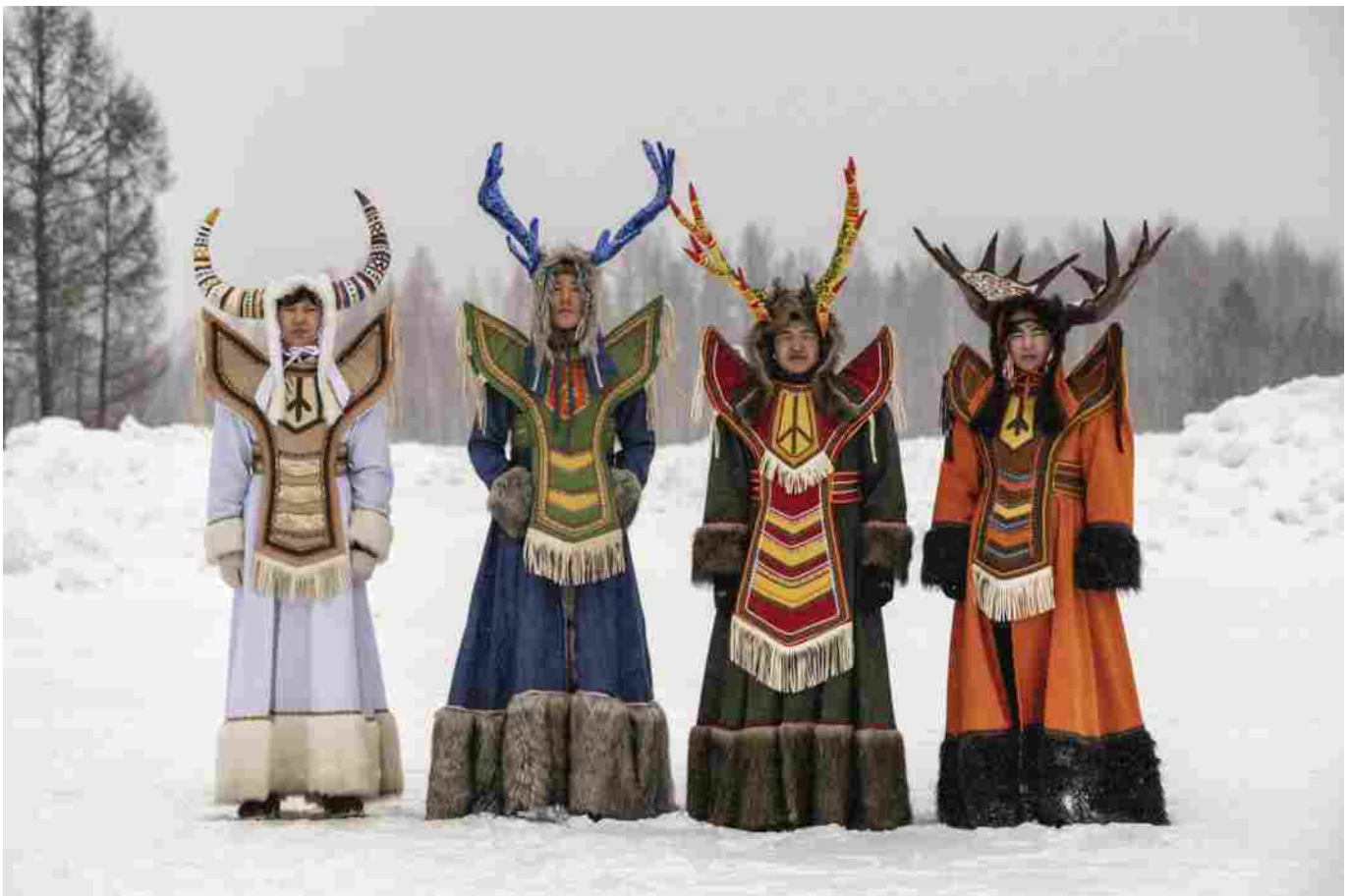
Permafrost #6